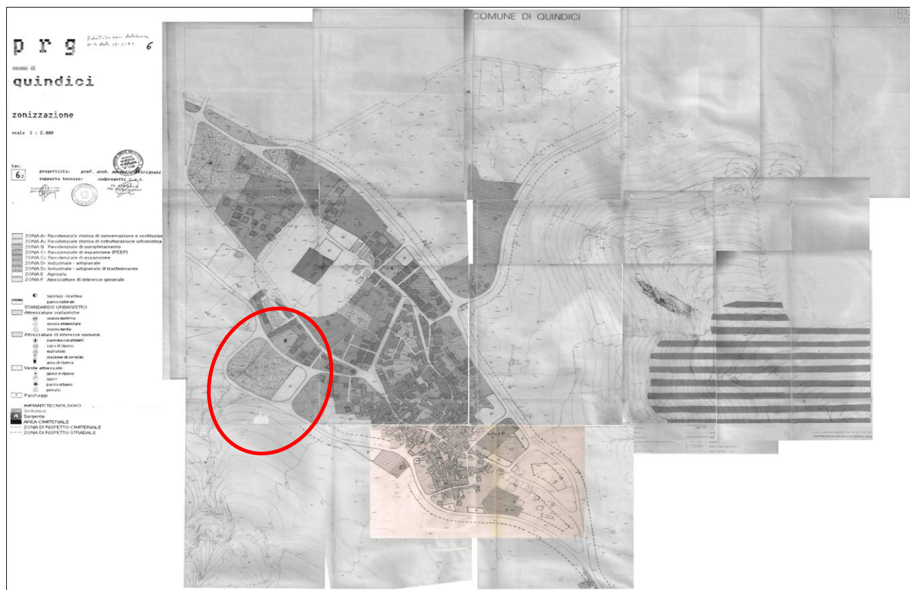
STRALCIO DEL PUC IN ADOZIONE

L'area è ubicata in prossimità di strade comunali ed in prossimità del centro cittadino; il progetto sfrutterà pertanto le rete ed i servizi esistenti in zona.